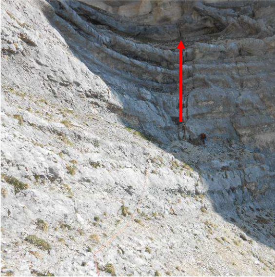
Point de départ de la voie