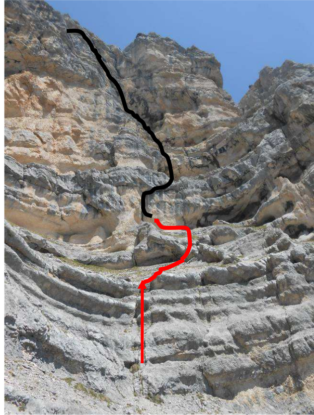
L1 et L2